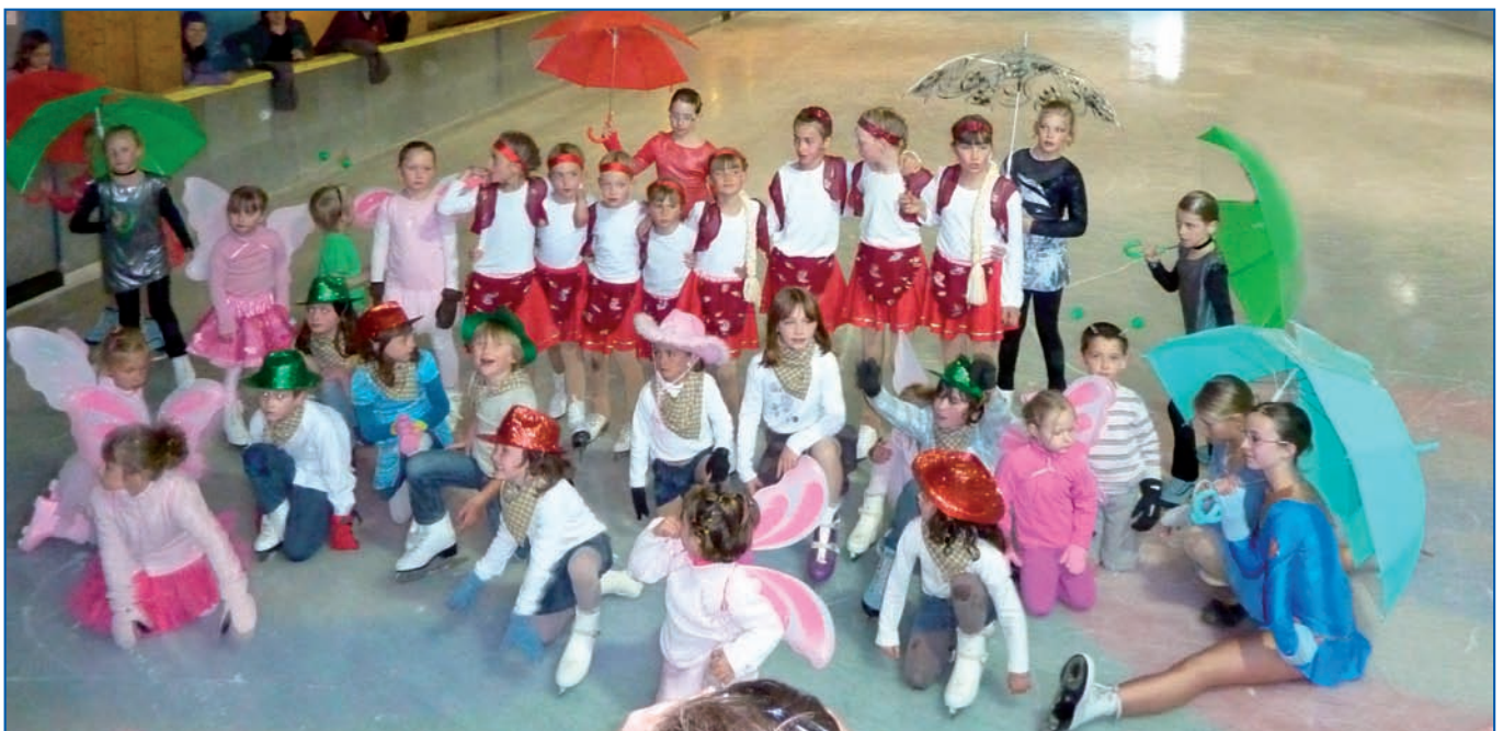
Gala donné par les patineurs prémanoniers à deux reprises au printemps 2011

www.jura-patinage.monsiteofficiel.com ou au 06 10 24 91 47 .